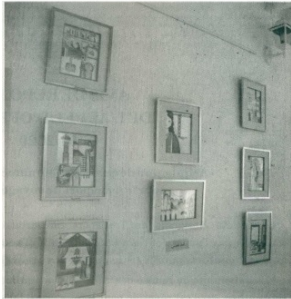
Les planches illustrant le livre ont fait l'objet d'une exposition, renforçant l'aspect visuel de la chose.